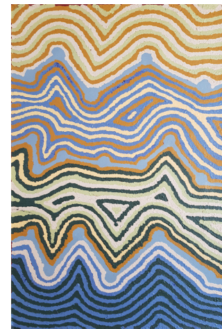
Helicopter Tjungurrayi Wangkarru, 2019 Acrylique sur toile