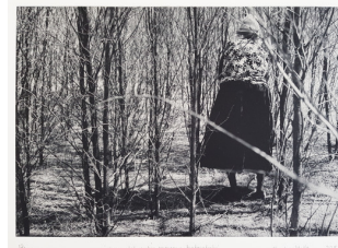
Christine Multa Napanangkulu watiya [...], 2015 Héliogravure